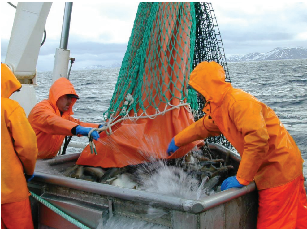
Bilde 2. Tømming av fisk fra snurrevadbåt med innmontert lerretsløft. Fisk løftes om bord i vannbad, og utsettes for lite eller moderat press.

Fra de største fartøyene kom det forslag til at omkretsen ble gitt i form av meter. Med kvadratmaske og stolper som går i sirkel rundt sekken skulle det ikke være vanskelig å gi eksakte mål på omkrets. Problemet som oppstår nå når flere av de større snurrevadfartøyene begynner å bruke 180 m/m masker, er at vidden på sekken blir alt for stor i forhold til vidden på løftet. Dette medfører vanskeligheter med å få fisken ned i løftet. Forskjellen på en kvadratmaskepose med 125 m/m kontra 180 m/m maskevidde blir ganske stor. 100 maskers omkrets med stolpelengde på 90 m/m gir en omkrets på ca 9 meter og med en diameter på rundt tre meter. Samme type sekk, men med 62,5 m/m stolpelengde gir en sekk med en omkrets på 6,25 meter og diameter på ca to meter. I volum vil den store sekken vær mer enn dobbel så stor som den minste. Det er dessuten tatt til orde for at den bakerste meter i kvadratmaskepose blir formet som et kremmerhus inn mot løftesekken.